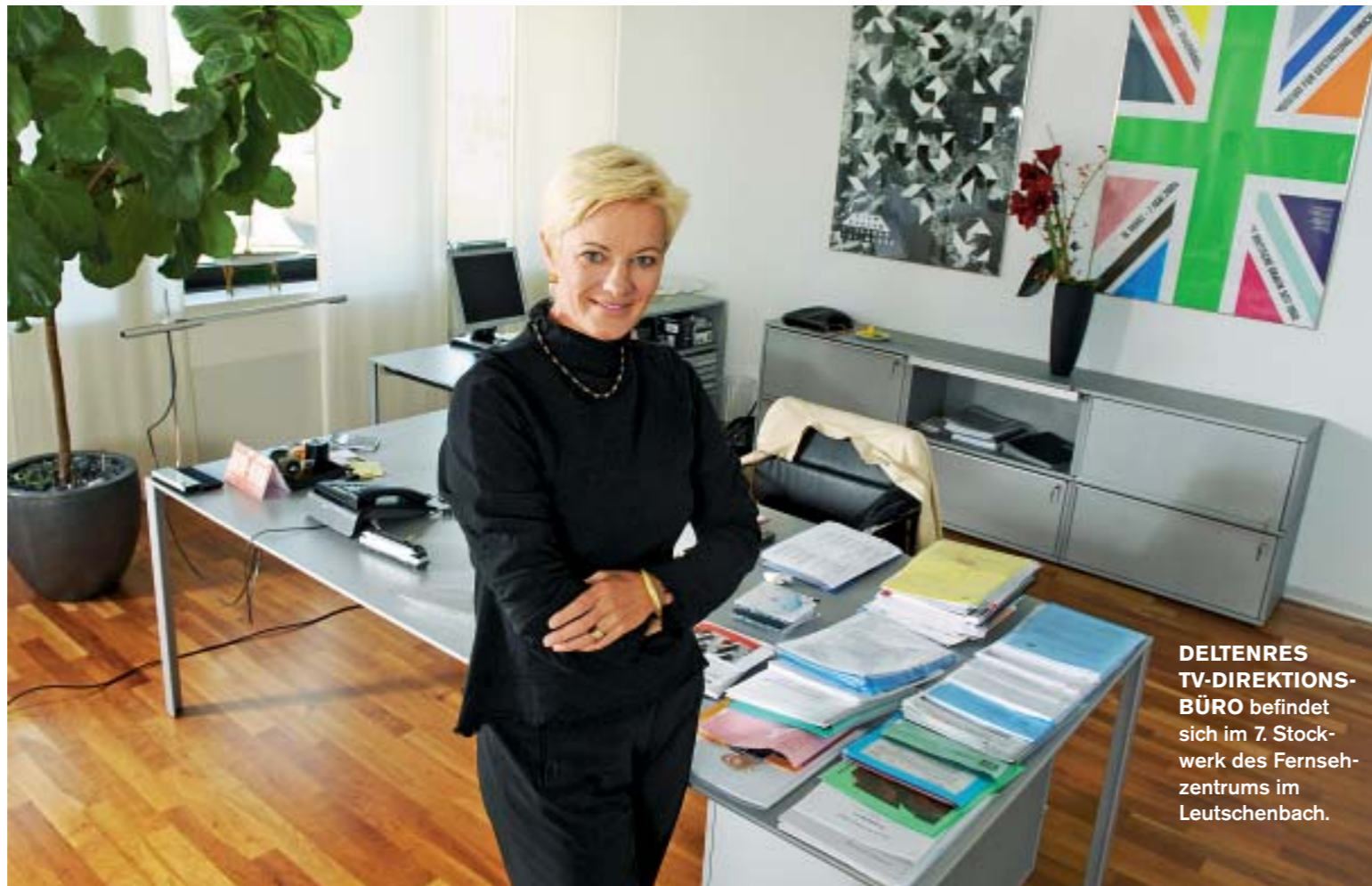
DELTENRES TV-DIREKTIONS-BÜRO befindet sich im 7. Stockwerk des Fernseh-zentrums im Leutschenbach.

Deltenre Wenn man jede neue Technologie bekämpft hätte, gäbe es heute noch kein Farbfernsehen. In unseren Nachbarländern wird technisch aufgerüstet. Wir leben nicht auf einer Insel, und schliesslich sind wir eine Visitenkarte dieses Landes. Ab jenem Moment, ab dem wir qualitativ hochstehendes HDTV senden, wird niemand mehr eine schlechtere Bildqualität empfangen wollen. Die SRG wird im Dezember 2007 einen Versuchs-