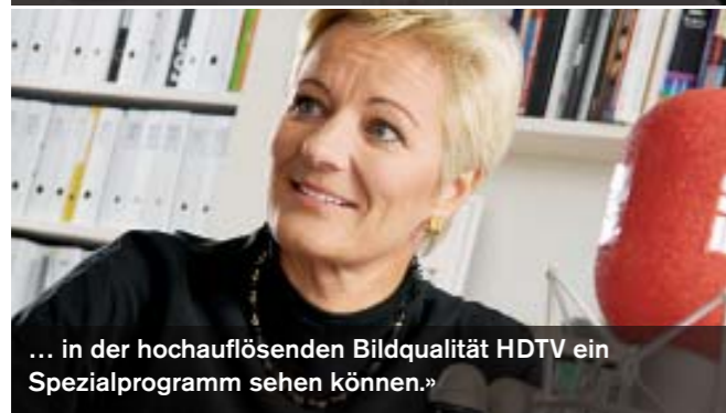
... in der hochauflösenden Bildqualität HDTV ein Spezialprogramm sehen können.»