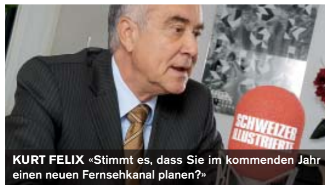
KURT FELIX «Stimmt es, dass Sie im kommenden Jahr einen neuen Fernsehkanal planen?»

Fernsehautor und Journalist Kurt Felix führt neu für die Schweizer Illustrierte monatlich einen Medientalk mit prominenten Zeitgenossen . Offene Gespräche, ein munteres Hin und Her. SF-Direktorin Ingrid Deltenre nahm als Erste vor unserem roten Mikrofon Platz.