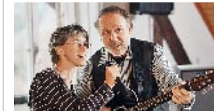
«Happy Day» macht auch quotenmässig glücklich