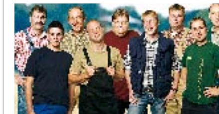
Heiratswillige Landwirte sahen ab