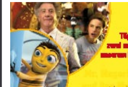
Täglich zwei mal in unserem Kiosk Kindercity

Na, so was! Vor einigen Wochen hatte noch Münchenerin Christine Neubauer, eine Kandidatin, die sie wegen Spekulanten (fast) aufgeben musste. Jetzt hat Wienerin Christiane Hörbiger ein Kaffeehaus, das einer Kette weichen soll. Zufall? Marketing-Gag? Nein: das Rosamunde-Pilcher-Gesetz der schlimmen Serie.