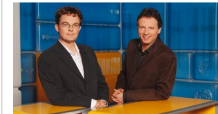
Seltene Quoten-Sieger: die «Kassenstürzer»