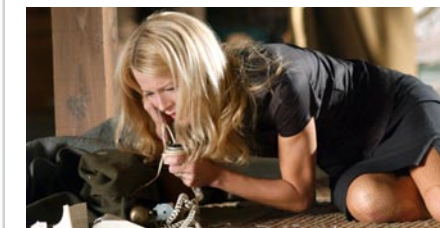
«Final Call»: Sie muss sterben, wenn er auflegt