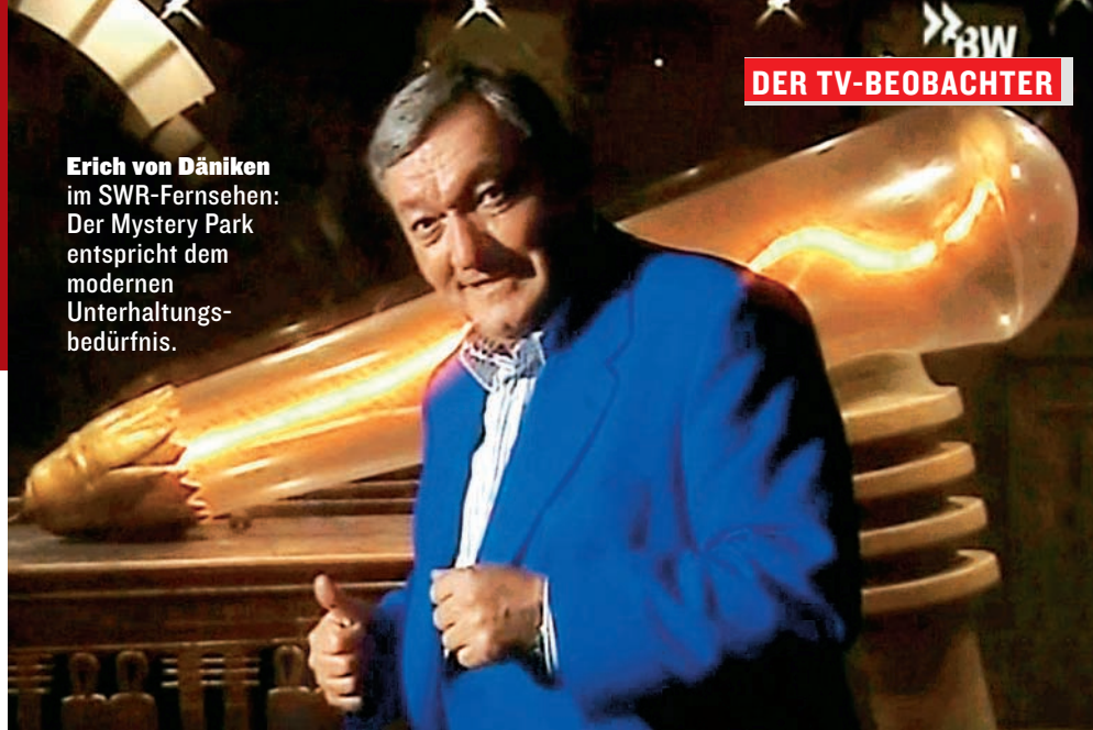
Erich von Däniken im SWR-Fernsehen: Der Mystery Park entspricht dem modernen Unterhaltungs- bedürfnis.

D ie verständlichste Formulierung, was denn Unterhaltung sei, heisst: geselliger Zeitvertreib. Die Franzosen sagen schlicht und einfach «amusement». Unterhaltung ist also etwas, das uns die leichte Seite des Lebens näher bringt. Das war schon immer so – wiewohl sich die Unterhaltung im Laufe der Jahrzehnte mächtig gewandelt hat. Geblieben ist jedoch das Vorurteil,