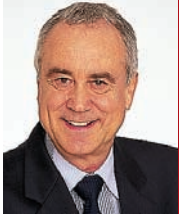
KURT FELIX über den stetigen Wandel der Unterhaltung in den letzten Jahrzehnten.